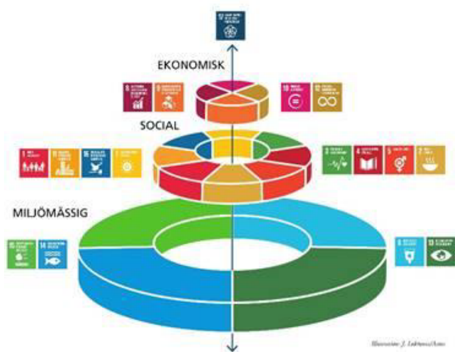
Bild: Bilden illustrerar hur olika aspekter av hållbarhet, och de 17 hållbarhetsmålen, hänger ihop och är beroende av varandra. Det miljömässiga utgör basen, och är avgörande för hur väl vi har möjlighet att uppnå de sociala och ekonomiska målen. Omvänt behövs en ekonomisk utveckling och ekonomiska metoder som hjälper samhället och oss alla att ställa om.